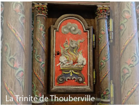
La Trinité de Thouberville