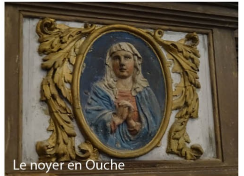
Le noyer en Ouche