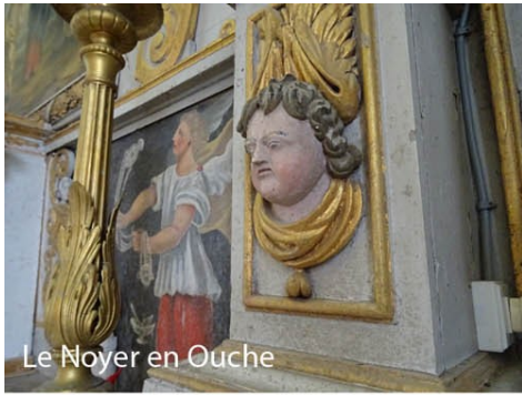
Le Noyer en Ouche