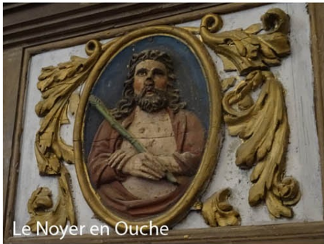
Le Noyer en Ouche