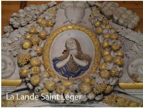
La Lande Saint Léger