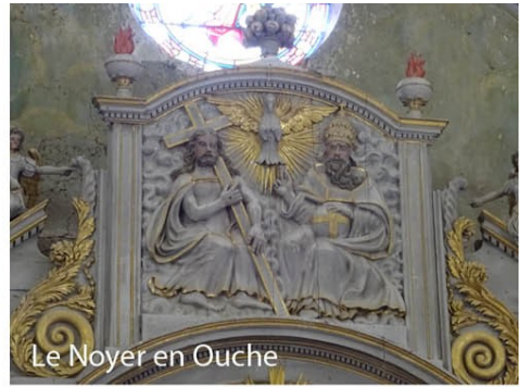
Le Noyer en Ouche