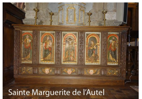
Sainte Marguerite de l'Autel